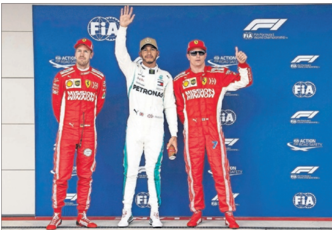
Vettel, Hamilton y Raikkonen fueron los más rápidos en la sesión de clasificación del GP de EE UU 2018.